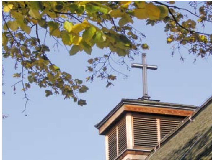
Foto: Kirchturm der Offenbarungskirche in der Simplonstraße

W ir, die älteren Kinder aus der Kinderkirche, verlassen nun die Kinderkirche und werden nach den Sommerferien zu den Konfirmanden gehören. Der Abschied aus der Kinderkirche steht bevor und wir möchten euch sagen, dass uns die Kinderkirche toll gefallen hat. Gefallen hat uns besonders das gemeinsame Essen. Vor jedem Essen zünden wir eine Kerze an und würfeln mit einem großen Würfel ein Gebet, das dann vorgelesen wird. Dann haben wir Obst und Brot gegessen.