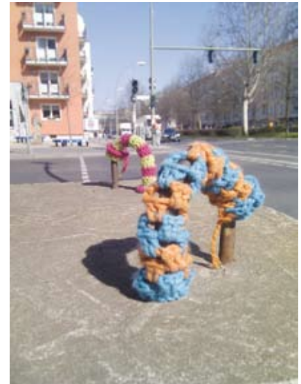
Foto: Guerilla Knitting an der Grünberger Straße / Ecke Warschauer Straße

Als ‚Guerilla Knitting‘ oder auch als ‚gestricktes Graffiti‘ bezeichnet man die Verschönerung von Plätzen durch selbstgestrickte Kunst.