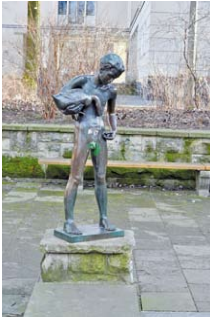
Foto: Weberwiese – Vor den Toren der Stadt bleichten ursprünglich die Weber und Färber ihre Tücher. Bis Ende des 19. Jahrhunderts hatten sie noch ihre Hütten rund um den Platz.