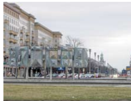
Foto: Strausberger Platz – In der Nähe des heutigen Strausberger Platzes befand sich im Mittelalter der Richtplatz von Berlin. Hans Kohlhasse (Kaufmann aus Cölln) wurde im Jahr 1540 auf dem Rabenstein in der Nähe des Georgtores, heute der U-Bahnhof Strausberger Platz, hingerichtet. Heinrich von Kleist, ein dt. Dramatiker, setzte ihm in seiner Novelle Michael Kohlhaas ein Denkmal.