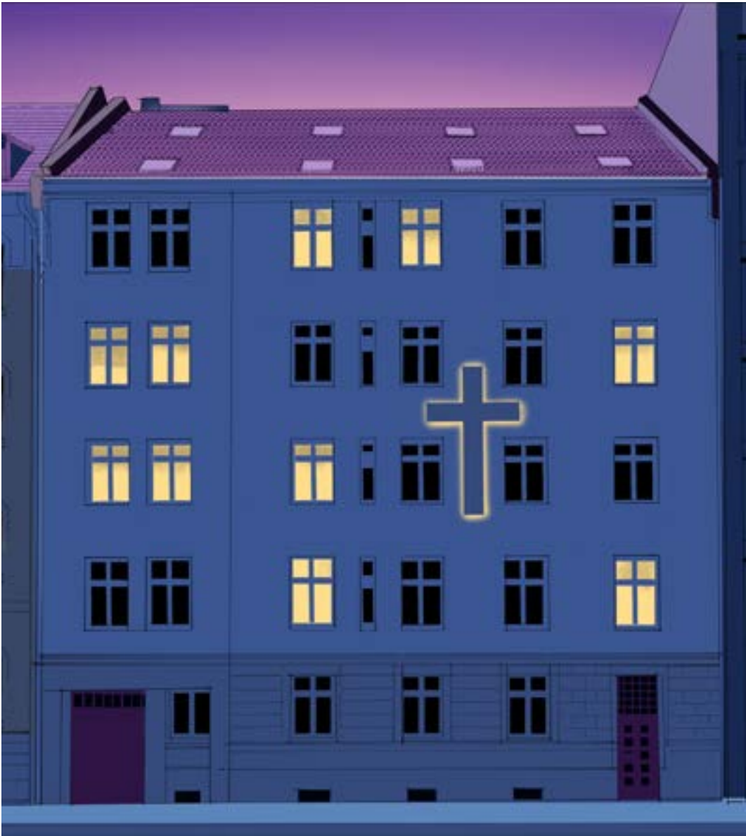
Abendstimmung am Andreas-Haus. Illustration von Lucca Böttcher © 2023